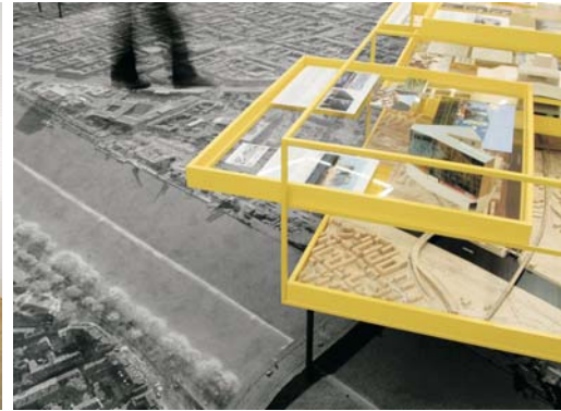
◀ Ausstellungsarchitektur von Robert Sessler zu „Du und deine Stadt“ im Saarlandmuseum/St.Johanner Markt, 1959. (Foto Julius C. Schmitt) ▶ Ausstellungsarchitektur von Jan Theissen und Sonja Nagel zu „10/400“ in Mannheim, 2007 (Fotos Zooney Braun).